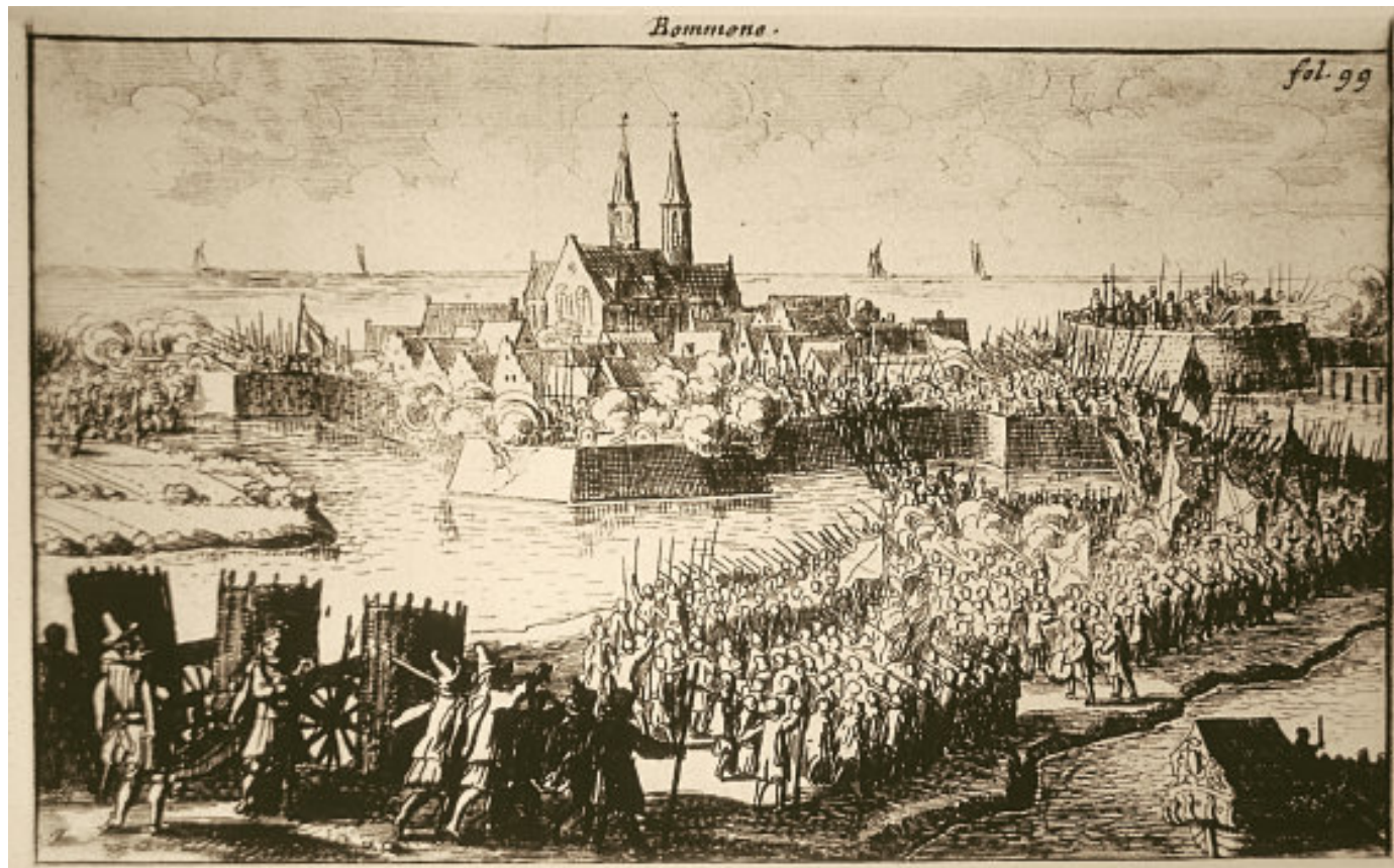
Het vestingstadje Bommene- de viel in 1682 ten prooi aan het water.

Verdrongen dorpen spreken tot de verbeelding en diverse legendes doen de ronde. Zo zagen vissers in afgelopen eeuwen soms de gouden daken van Reimerswaal schitteren in de diepte. Ook klonk van onder de golven regelmatig het desolate geluid van de kerkklokken van de verdrongen stad. Dit soort verhalen zijn niet specifiek Zeeuws, want Bretonse vissers vertellen precies hetzelfde verhaal over de verdron-