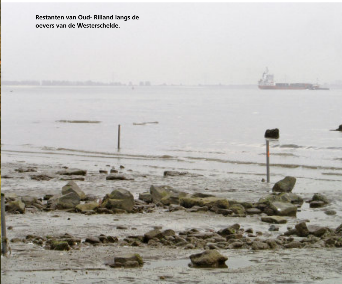
Restanten van Oud- Rilland langs de oevers van de Westerschelde.

Een andere boosdoener was het turfsteken of 'darinck delven'. Op veel plaatsen staken de eilanders