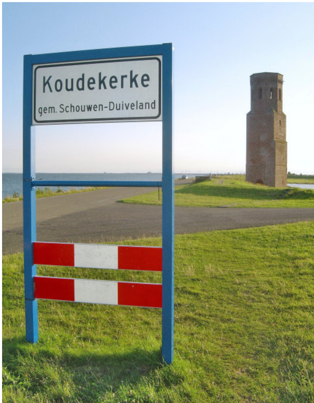
De Plompe Toren is het enige dat rest van het verdrinken dorp Koudekerke.

ken Bretonse stad Ys. Bekend is ook het verhaal van de zeemeermin. Vissers uit Westerschouwen vingen ooit een zeemeermin in hun netten. Haar echtgenoot smeekte de vissers om haar vrijlating, maar de vissers wilden niet luisteren en namen de zeemeermin mee aan land, waar ze stierf. De zeemeerman ontstak daarop in woede en sprak een vloek uit over het dorp: «Westerschouwen, 't zal u rouwen, dat ge hebt geroofd mijn vrouwe! Westerschouwen zal vergaan, al-